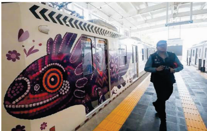
这是墨西哥城轻轨车厢上的钝口螈艺术图案。

本届世界杯是墨西哥城向世界展示自己的好机会。钝口螈的形象确实容易让人记住这座城市，但争议在于当钝口螈在现实中濒临灭绝之际，大笔花钱将其形象应用于公共空间的意义何在？世界杯真正能留下什么，终究不取决于几面彩墙、几座雕像和几张合影。