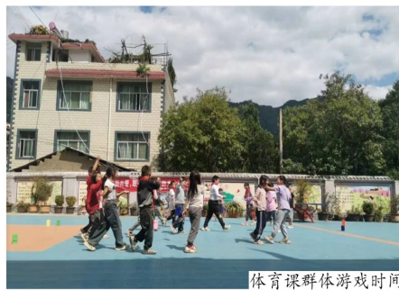
体育课群体游戏时间

第一，寻求实实在在的成长。在城市工作时，生活便捷、工作有领导安排，遇到问题习惯求助他人；而到了山区，几十里山路让生活诸多不便，缺东西要凑时间补齐，物品坏了只能自己动手修理或者找身边人修。同时，山区生活让人降低物欲，也能攒下不少钱。更重要的是，教师职业能锻炼组织、沟通、管理、解决问题等通用能力，可适用于任何职业，受益终身。