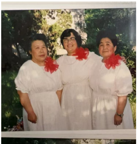
退休后的母亲(左)与同事们在母亲节演唱时的合影

已被岁月摩挲得柔软而古朴。每当目光扫过，它便像一道无声的召唤，将我拉回几十年前那个普通的秋夜。