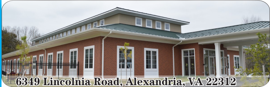
6349 Lincolnia Road, Alexandria, VA 22312