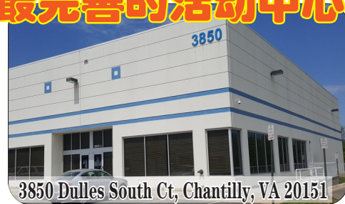
3850 Dulles South Ct, Chantilly, VA 20151