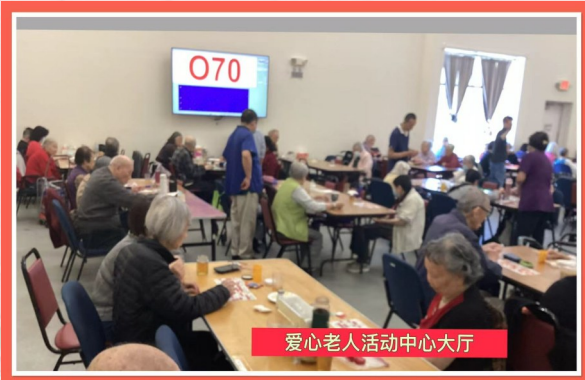
爱心老人活动中心大厅