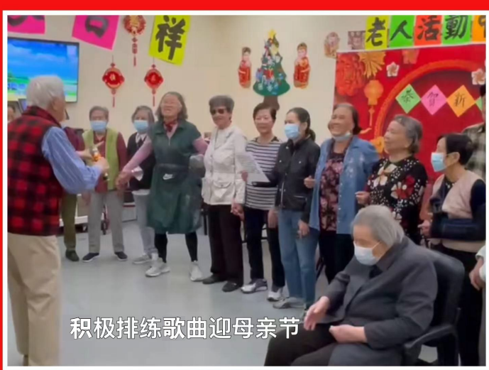
积极排练歌曲迎母亲节