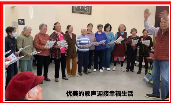
优美的歌声迎接幸福生活