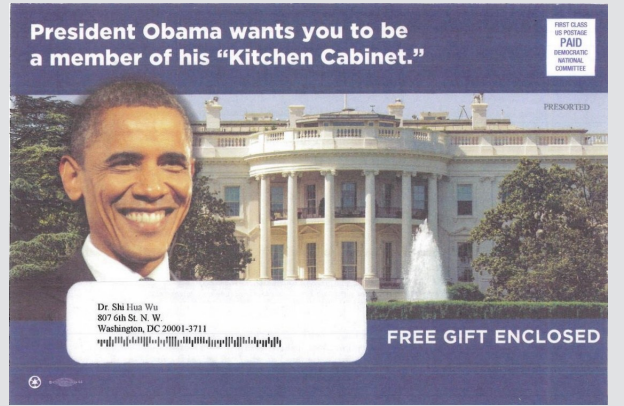
2013年7月，奥巴马总统给吴世华寄厨房内阁(Kitchen Cabinet)荣誉成员委任状的信封正面。