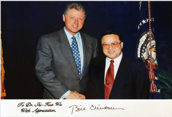
1998年，美国总统比尔·克林顿接见吴世华。照片上有克林顿亲笔签名。坊间流传着吴世华用中成药“胖大海”为克林顿治疗嗓子的故事。