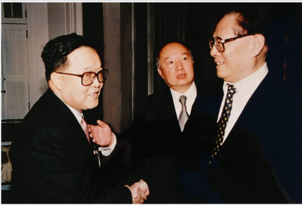
1997年10月，中国中央总书记、国家主席、中央军委主席江泽民对美国进行国事访问期间同吴世华亲切握手交谈；中国驻美大使李道豫正在向江泽民介绍吴世华