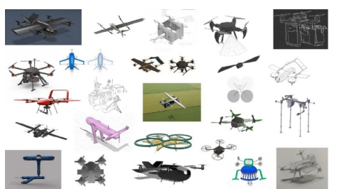
2025-2026 Dream with Us Design Challenge Winners - High School Group