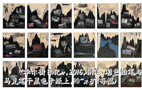
《华尔街日记》, 2016, 钢笔、彩色铅笔与马克笔于黑色卡纸上, 10" x 8" (每幅)