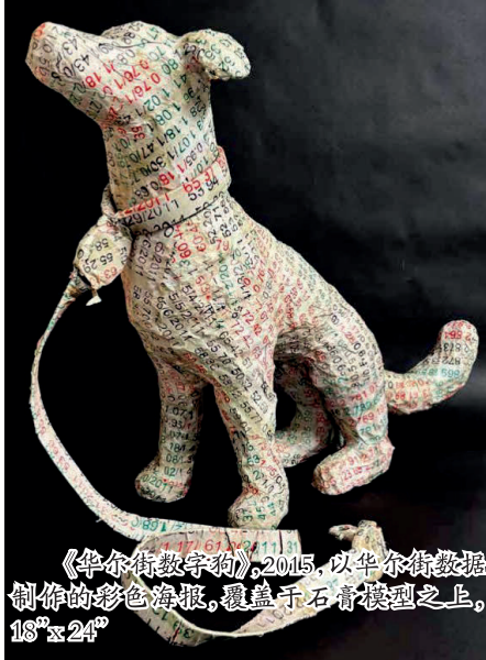
《华尔街数字狗》, 2015, 以华尔街数据制作的彩色海报, 覆盖于石膏模型之上, 18" x 24"