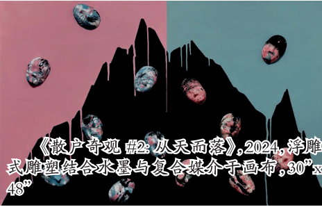
《散户奇观 #2: 从天而落》, 2024, 浮雕式雕塑结合水墨与复合媒介于画布, 30" x 48"