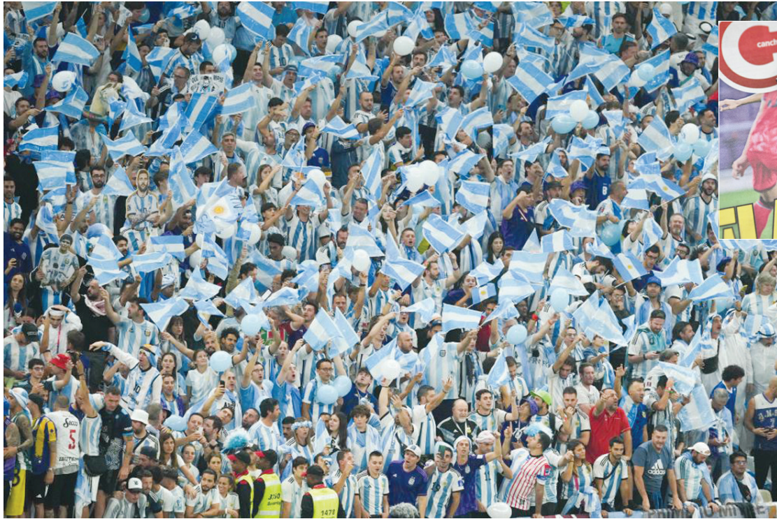
2022年12月18日，阿根廷队球迷在比赛中助威。当日，在卡塔尔卢赛尔球场进行的2022卡塔尔世界杯足球赛决赛中，阿根廷队对阵法国队。

进一步推高了价格。国际足联推出官方转售平台，这一举措虽有助于从源头减少假票问题，但国际足联对每笔交易向买卖双方各收取15%的服务费，即单笔交易合计抽取约30%。在此机制下，卖方通常通过提价来覆盖成本。