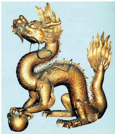
藏于枫丹白露宫中国馆的青铜雕龙