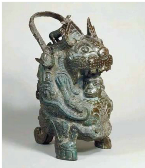
藏于法国巴黎赛努奇博物馆的虎卣