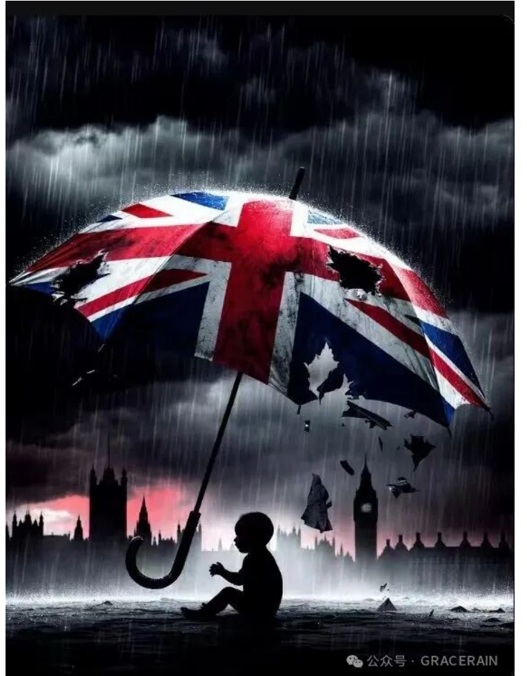
公众号 · GRACERAIN

突进。大量非西方移民涌入，尤其是某些群体带来的价值观冲突，被他们以“多元”为名纵容或回避。Rotherham, Rochdale 等地的性侵团伙，正是这种“多元失败”的血淋淋注脚：当权者宁可牺牲本土女孩，也不愿“冒犯”少数族裔社区”。