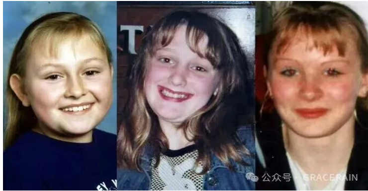
公众号 · GRACERAIN