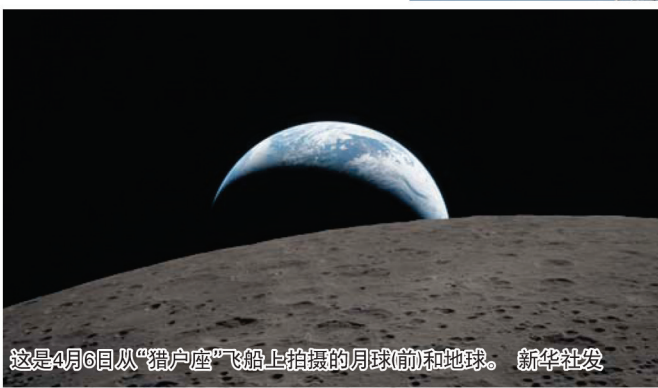
这是4月6日从“猎户座”飞船上拍摄的月球(前)和地球。