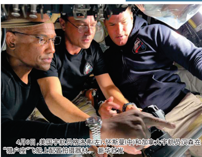
4月6日,美国宇航员格洛弗(左)、怀斯曼(中)和加拿大宇航员汉森在“猎户座”飞船上配置拍摄器材。

一是深空环境下的通信与导航系统测试。飞船在地球轨道短暂飞出全球定位系统卫星及近地中继卫星覆盖范围,检验深空网络的通信与导航能力,确认相关系统为深空任务做好了准备。