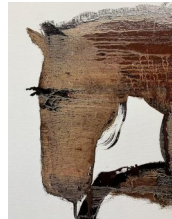
图2 油画·马 文/画 帅权轩

七古·题马（图2） 文/画 帅权轩 一身风土入苍茫，低首无声立暮空。 莫言不作千里去，骨里仍藏万里风。