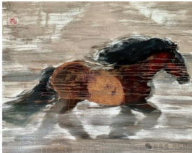
图1 油画·奔马 文/画 帅权轩

七绝·奔马（图1） 文/画 帅权轩 朔野寒嘶裂雪行，长风踏雪向前征。 人间最是艰难处，不是扬蹄是忍撑。