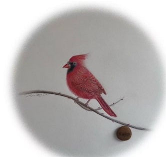
彩绘·红雀图 夜阑风静

凌乱的狂风在窗外肆意 张牙舞爪 滂沱的大雨从天而降 挥洒向大地 繁茂的枝叶随风摇曳 舞动腰肢 于空霹雳 听雨敲打着玻璃的声音 午时临窗 静观风雨 台前的萱草花安然的盛开 无视外界的喧嚣 此时的心境 仿似世间万物皆与我毫无关系 一纸信笺 空无一字 思绪万千 无从落笔 想暴风骤雨之后 是否会有那一道彩虹出现 想我的睡莲在雨打中 是否依旧坦然无恙 想我的花儿在风吹后 是否依旧艳丽挺拔 想外面的空气在洗礼后 是否会变得清新 一切的一切都是自由的 无拘无束的 思想的放飞 可穿越那千山万水 心灵的绽放 可看透这繁华闹市 一片净土 一片静土 吾心欢愉 笑看人间世事