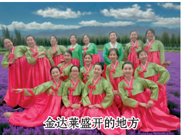
金达莱盛开的地方