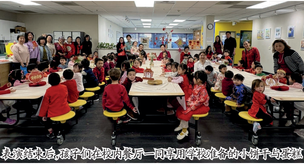
表演结束后,孩子们在校内餐厅一同享用学校准备的小饼干与蛋糕