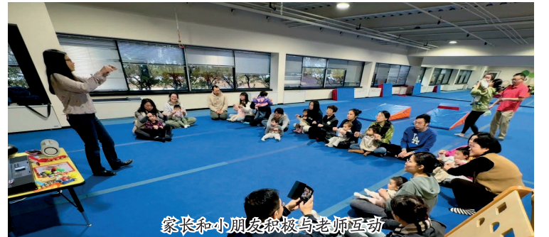
家长和小朋友积极与老师互动