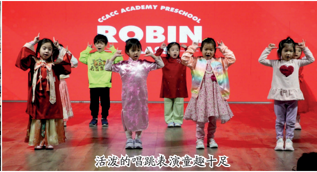
活泼的唱跳表演童趣十足