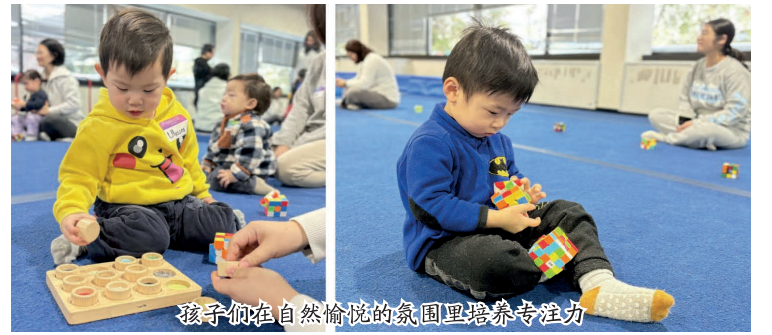
孩子们在自然愉悦的氛围里培养专注力