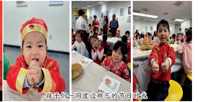
孩子们一同度过难忘的节日时光