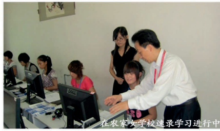
在农家女学校速录学习进行中

我常去会场实习，任务是给速录师挑错，却屡屡落空——专业速录师会及时修正少数错别字。我幡然醒悟，以当时的认知根本挑不出错，实习的核心实则是观察速录师的全流程工作，从会前准备到会后排版，这段经历让我受益匪浅。