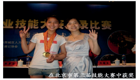
在北京市第三届技能大赛中获奖

录师这份职业——工作纯粹、人际关系简单、高效快捷，离场后便无牵绊，可奔赴下一场工作或享受生活。