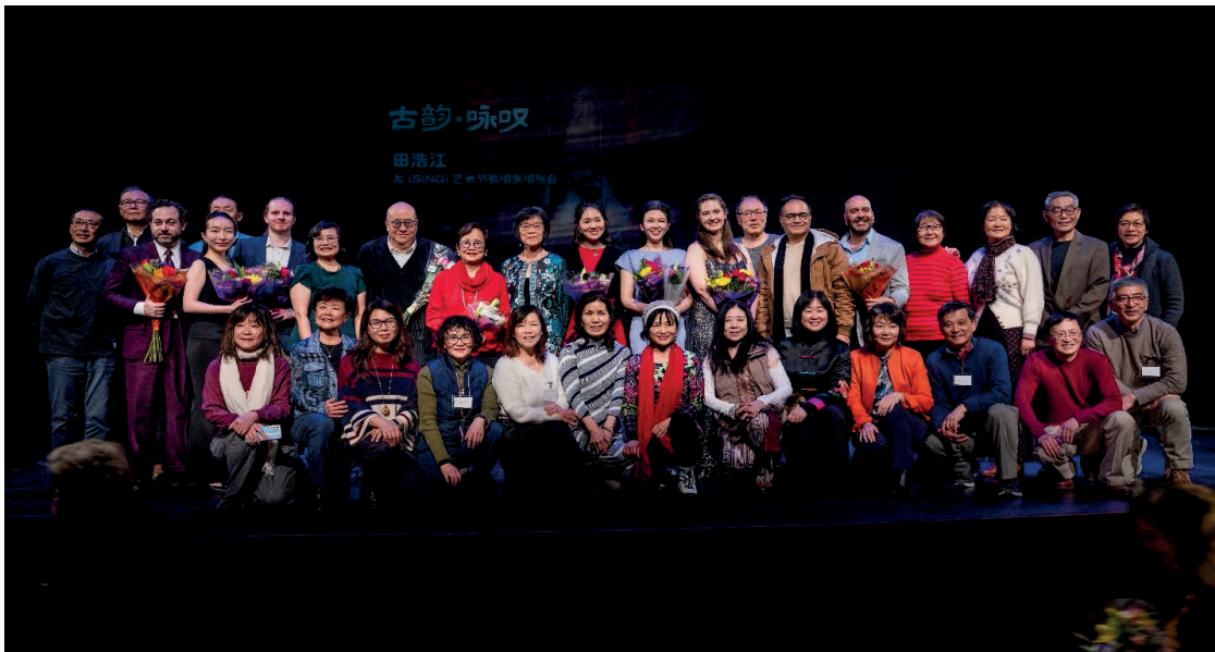
田浩江和与会的 iSING! 艺术家们

今年立春后的二月八日，刚刚遭遇风雪和寒潮来袭的华府地区，依然是天地冰封，朔风凛冽。当天下午在华盛顿郊外的 The Bender JCC of Greater Washington 剧院，一场名为《古韵·咏叹 - 田浩江与 iSING! 青年歌唱家唱聊会》的专场艺术表演与交流，正在这里热烈展开。蜚声世界歌剧舞台的著名歌唱家田浩江，携六位中美青年歌唱家前来华府，与半杯清茶社携手，举办一场即兴式的西洋歌剧咏叹调及中国民歌演唱会，拉开了国际青年歌唱家艺术节 (iSING!) 成立十五周年系列庆祝活动的序幕。值此中国农历新年来临之际，这场融合中西经典歌唱艺术于一体的高水准声乐展示和文化交流活动，于寒冬之日为华府侨社带来既温情思乡而又热情奔放的节日气氛，在与会的各界观众中引起了非常热烈的回响和高度的情感共鸣。舞台上，老歌、咏叹、诗朗诵有机交织；会场中，掌声、歌声、欢笑声不绝于耳。