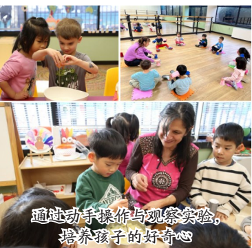
通过动手操作与观察实验，培养孩子的好奇心

随着家长对幼儿教育品质与语言能力培养的重视日益提升，美京博雅苑 (CCACC Academy) 持续以专业与口碑，成为社区中备受肯定的学前教育机构。作为一所享有盛誉的中文浸入式双语学校，美京博雅苑致力于为2至5岁幼儿提供一个温暖关怀、启发潜能、融合蒙特梭利理念的学习环境，陪伴孩子稳健踏出学习的第一步。