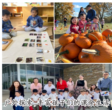
户外探索，丰富孩子们的课余生活