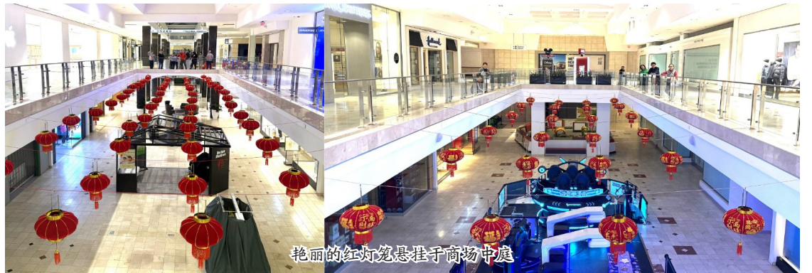
艳丽的红灯笼悬挂于商场中庭