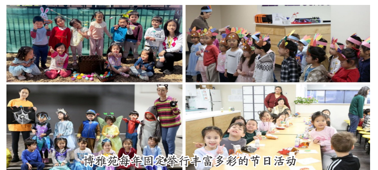
博雅苑每年固定举行丰富多彩的节日活动