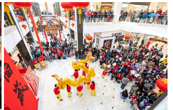
贺岁活动吸引大批民众驻足观赏