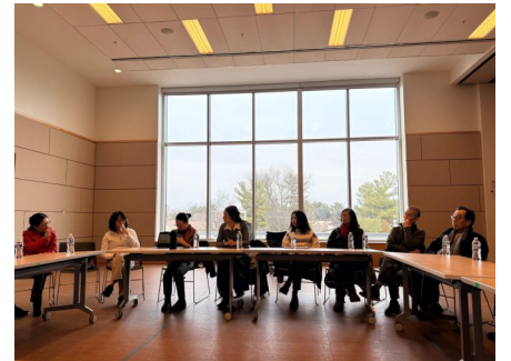
希望中文学校盖城校区 2026春教学经验交流会

希望中文学校盖城校区真诚欢迎更多的同学和家长们加入。我校位于马里兰州德国镇西北高中，欢迎大家访问学校网页了解详细信息！学校网址 https://www.hopechineseschool.org/hcsgb/