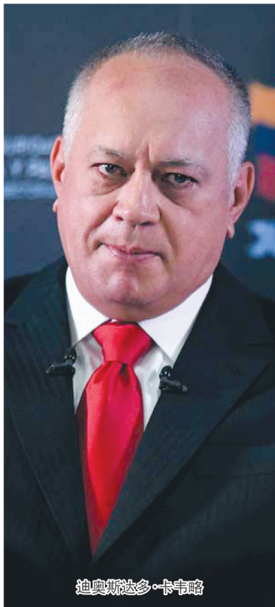
迪奥斯达多·卡韦略