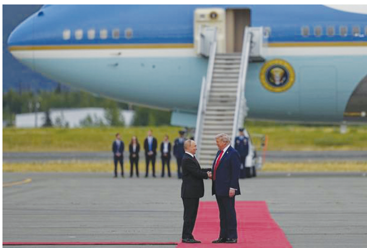
8月15日，美国总统特朗普和俄罗斯总统普京在美国阿拉斯加州安克雷奇市埃尔门多夫-理查森联合军事基地的机场握手。

8月15日的阿拉斯加，吸引了全球目光——特朗普重返白宫后，美俄首次元首会晤在当地最大城市安克雷奇附近的埃尔门多夫-理查森联合军事基地举行。当天，特朗普在机场迎接普京，还安排了F-22战机静态展示，以及B-2战略轰炸机与F-35战机编队飞行助兴。