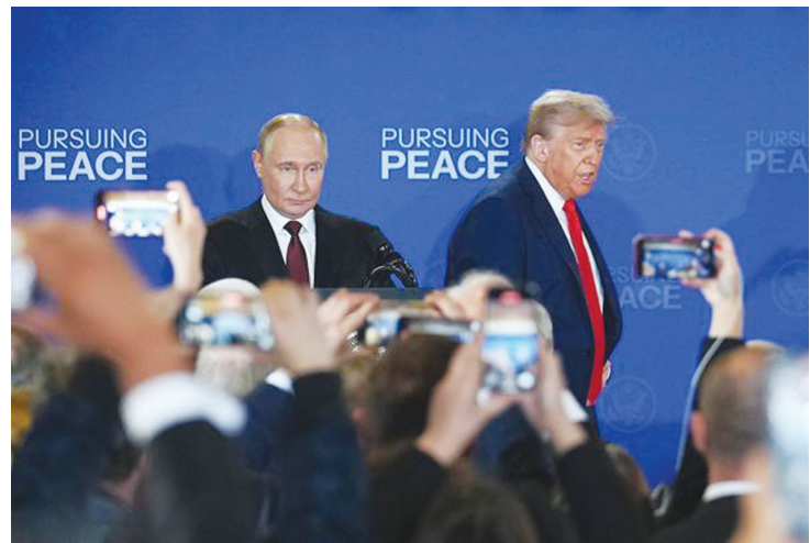
8月15日，美国总统特朗普与俄罗斯总统普京在美国阿拉斯加州安克雷奇市埃尔门多夫-理查森联合军事基地举行会晤后共同出席联合记者会。

会晤后普京曾邀请特朗普下次在莫斯科会晤，后者称这一提议“有意思”“可能发生”。后来，特朗普还对媒体透露，他希望普京来美国参加美加墨合办的2026年足球世界杯相关活动。