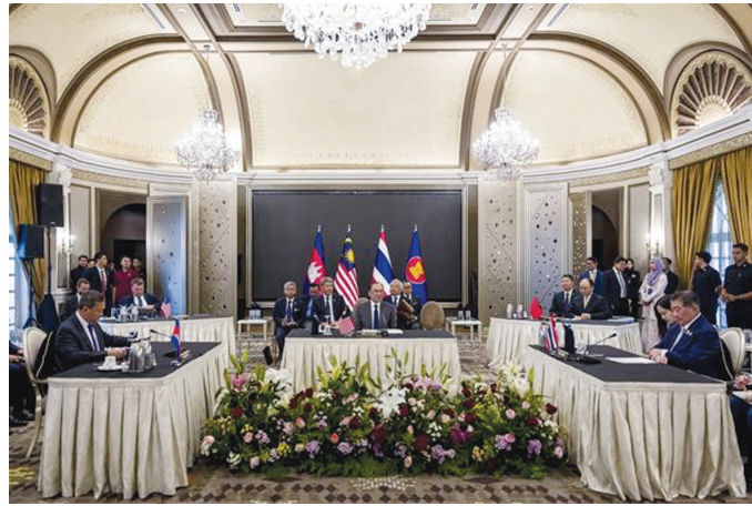
这是7月28日在马来西亚总理官邸拍摄的泰柬两国边境局势特别会议现场。