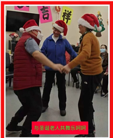
与圣诞老人共舞乐呵呵