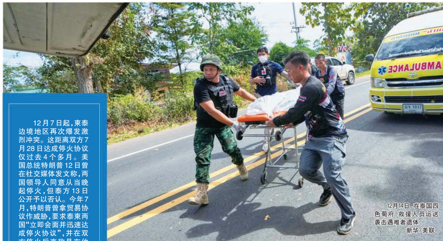
12月14日,在泰国四色菊府,救援人员运送袭击遇难者遗体。

然而,12月11日,泰国宪法修正案草案在下议院进行二读审议时,自豪泰党转变立场,支持上议院控制修宪条款,导致草案二读未获通过,引发人民党不满并威胁对阿努廷政府提出不信任动议。鉴于阿努廷领导的是少数派政府,无