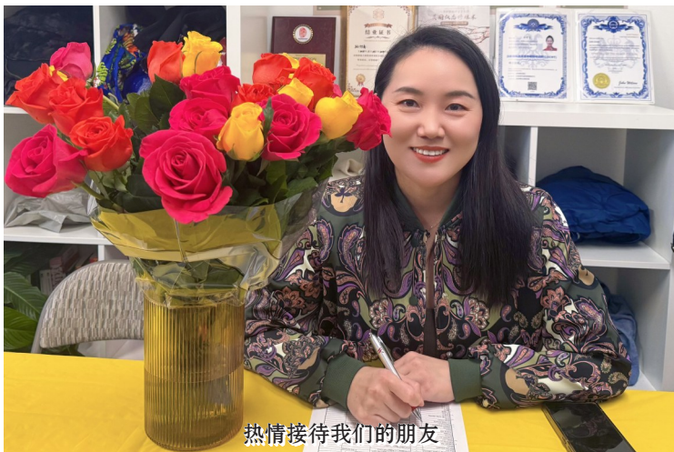
热情接待我们的朋友