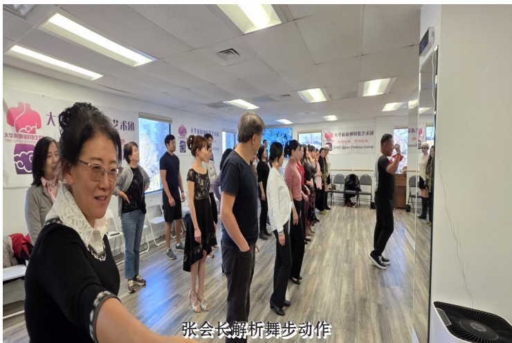
张会长解析舞步动作