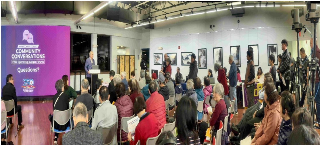
问答环节时,发言者有序的排队等候