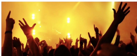
七律 呐喊 (平水韵 新韵 通韵) 雨子诗 新海书 二零二四不平常,各路英雄竞逞强。黑海河边兵士死,加沙城内庶民亡。战争贩子捞油水,穷苦人们饿肚肠。天地良心何在处,何人硬把地球伤? ——2024年2月25日

远望着起舞的群山,脚踏着岩下的波澜,身披着霏霏的祥雨,咀嚼着好友的箴言:您老了,别再浮想联翩;回归家庭,享受晚年!——呵,是的,人生谁无死,闭目何留恋?但……加沙城倾倒的高楼撞击着我的身躯,