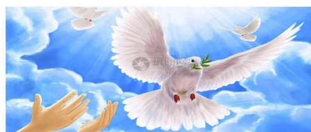
生愿 ——敬献著名作家岩波,摄影大师远望 雨子诗 新海书 2025年3月11日

啊!我是一位和平的使者,我是一颗华夏的幽灵。飞离那广袤的大地,飘游在浩瀚的长空。阅尽了人间的春色,忧心着大地的寒冬。黄河的浪涛给了我无穷的动力,