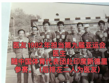
医友1982年担当第九届亚运会 医生 随中国体育代表团赴印度新德里 参赛。(后排左二人为医友)

谢谢电脑，谢谢AI， 谢谢童年的我， 谢谢现在的我， 我终于实现了自己的梦想—— 在变幻中，找到真实的自己。 https://youtu.be/UTtpjM8uXw