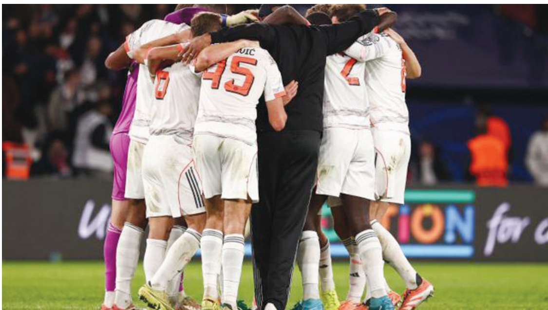
孔帕尼赛后第一时间冲入场内和弟子围圈庆祝的画面令人感动。