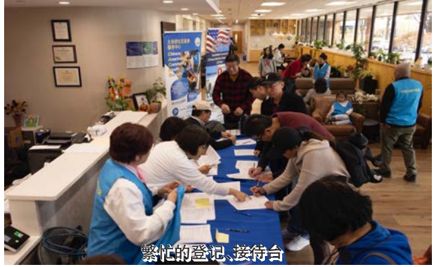
繁忙的登记、接待台