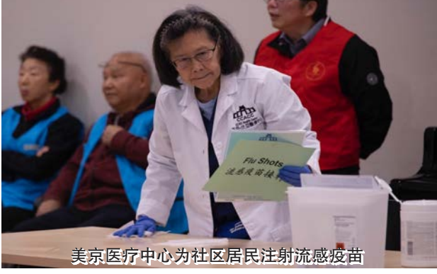
美京医疗中心为社区居民注射流感疫苗