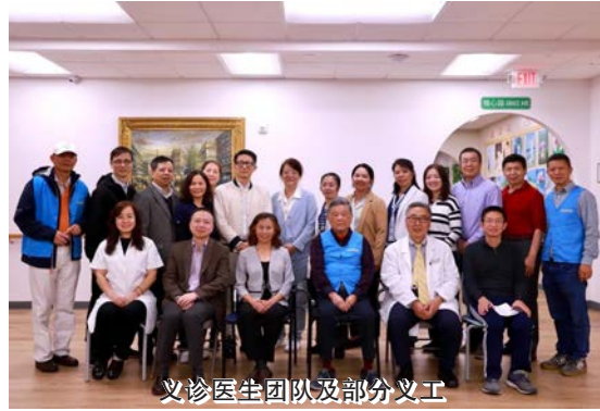
义诊医生团队及部分义工