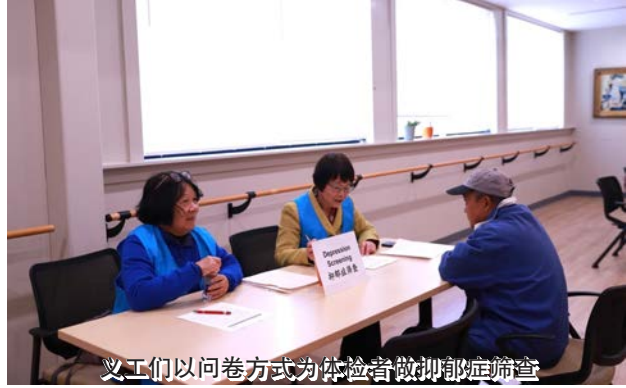
义工们以问卷方式为体检者做抑郁筛查