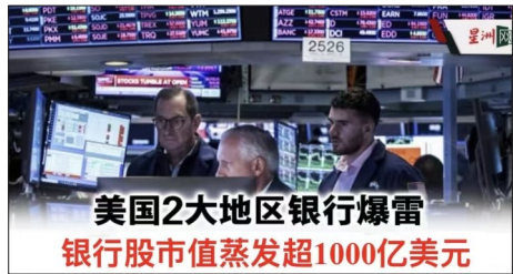
美国2大地区银行爆雷 银行股市值蒸发超1000亿美元

10月16日(周四), 美国两大地区银行锡安银行(Zions Bancorp)和西部联合银行(Western Alliance Bancorp)先后宣布: 贷款欺诈、坏账爆仓、资金失踪! 这不是“警报”, 而是——“引爆”!