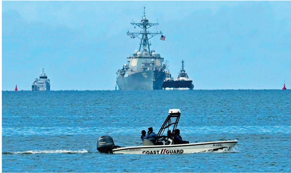
10月26日,美军导弹驱逐舰“格雷夫利”号(上中)在特立尼达和多巴哥首都西班牙港附近海域航行。

委内瑞拉外交部长希尔当地时间27日说,已挫败由美国中央情报局资助的一起“假旗”行动,该行动策划袭击停靠在加勒比海的一艘美国军舰并嫁祸于委内瑞拉。同一天,实时航班追踪网站数据显示,两架美国B-1B“枪骑兵”轰炸机再次逼近委内瑞拉。