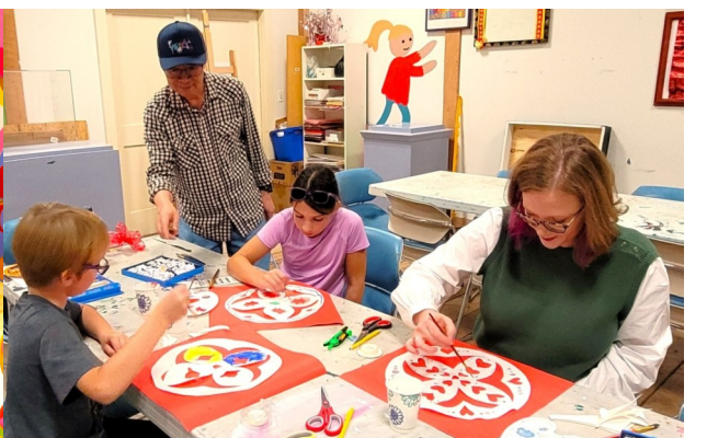
在桑迪斯普林博物馆工作坊小组上黄闪夜辅导学员作彩绘剪纸