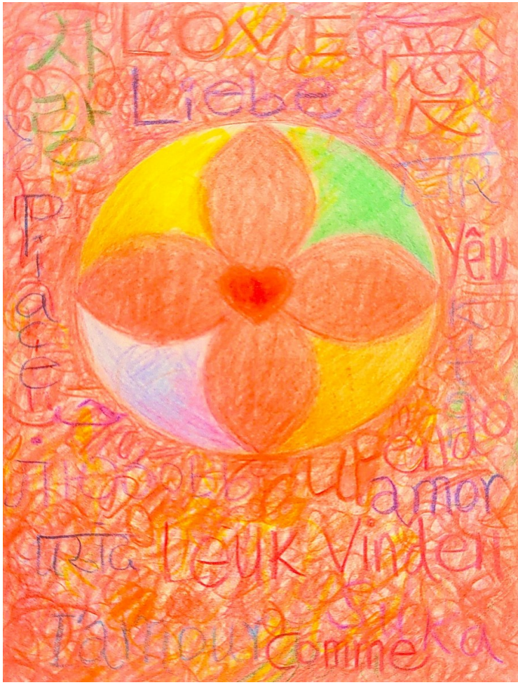
奥地利文字博物馆展出的黄闪夜作品手稿《爱》

从美国东海岸文化博物馆到英国兰卡斯特大学当代艺术学院，从马里兰州桑迪斯普林博物馆到奥地利文字博物馆，著名华裔壮族艺术家黄闪夜(Shanye Huang)以其家乡民族优秀传统文化为灵感和在异乡所见所思，融合实验性与当代转换手法创作作品，近月来通过在欧美博物馆与艺术院校的展览和工作室，邀请国际观众感知壮族传统文化的内在精神力量与个人艺术表达，传递“爱与祝福”的文化核心价值，展现家乡传统文化的恒久魅力和当代活力。