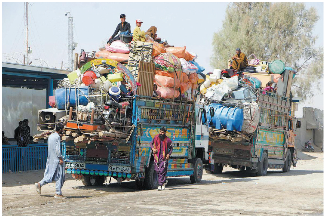
当地时间10月19日，阿富汗坎大哈省斯平布尔达克，阿富汗难民携带行李在阿巴边境返乡。

“中方愿意同国际社会一道努力，继续为巴阿关系改善发展发挥建设性作用。”郭嘉昆说。