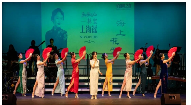
△特邀伴舞：春光好表演艺术中心旗袍时装艺术团