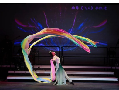
△特邀伴舞：春光好表演艺术中心旗袍时装艺术团