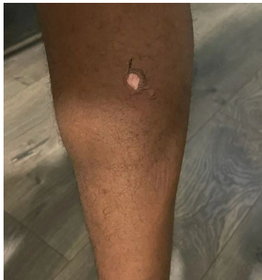
(顾客右腿受伤的照片。)

我看着华人业主提供给我的受伤照片,同意这不是什么大事,是对方小题大做了。请看照片: