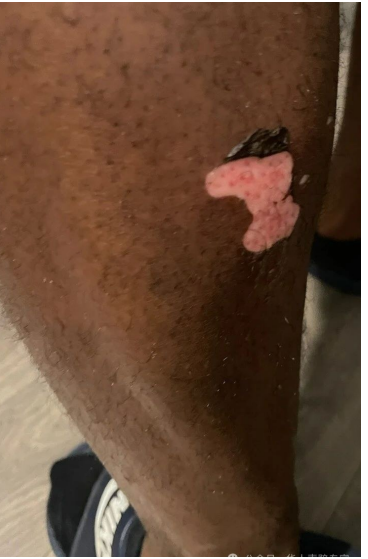
(顾客左腿受伤的照片。)

一般情况下,我代表的是受伤者的原告,比如说车祸里受伤的人,工作场所或者医疗机构里面受重伤的人。但是出于多个原因,这位华人业主打动了。她是一个诚实的商人,她的成功的事业受到了不公平的威胁;她此前看了我的一些文章和录像,非常欣赏信任我;她愿意先付大笔定金,然后按