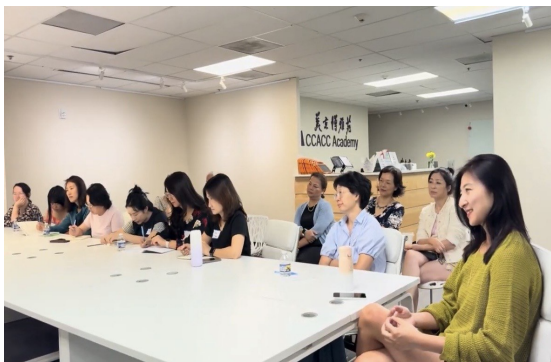
家长们专注参与，认真记录分享内容