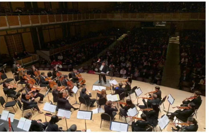
古风抒情诗 交响魂

它是一道风景线, 让诗与美融入日常; 它是一座桥梁, 让热爱与梦想在此相连。四载潮起, 梦已悠悠; 未来可期, 歌将更嘹亮。愿“潮起如歌” 继续以诗为笔, 以爱为墨, 在金陵大地上书写更多精彩, 让诗意之花绽放在每一个热爱生活的心中。