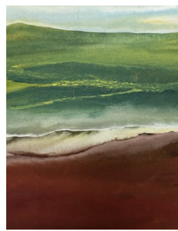
《青山翠谷》, 金底板水彩, 2018