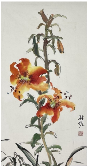
《金针花》, 宣纸水彩, 2015