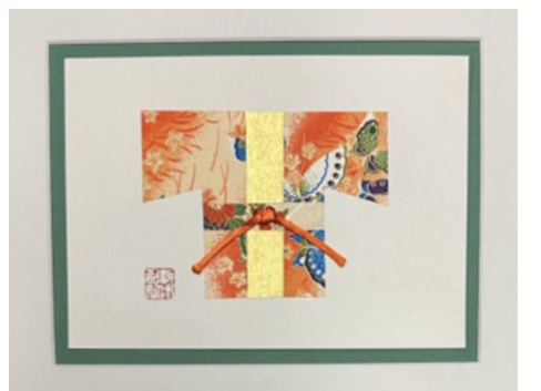
小幅 Kimono (和服) 拼贴作品