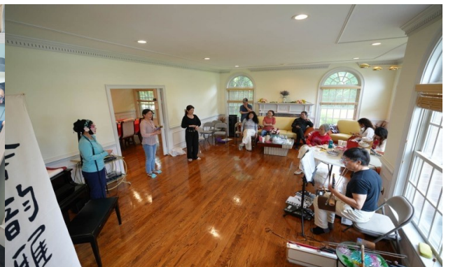
馨韵雅集社员吊嗓聚会即景