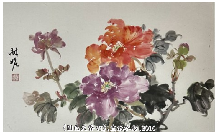
《国色天香 VI》，宣纸水彩，2016