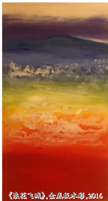
《浪花飞溅》，金底板水彩，2016