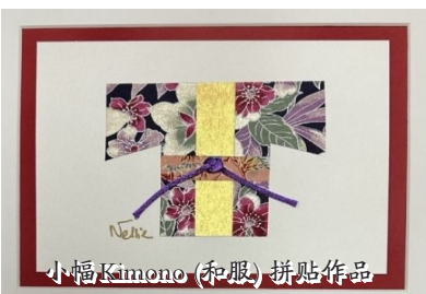
小幅 Kimono (和服) 拼贴作品