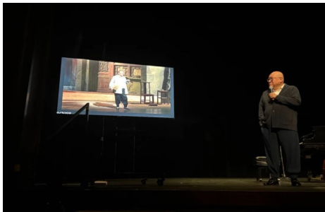
(国家大剧院歌剧《骆驼祥子》,饰演刘四爷)