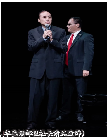
(开场:新世界时报社长倪涛,华盛顿邮报社长清风致辞)