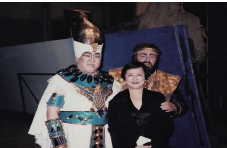
(与帕瓦罗蒂一起合作多部歌剧)