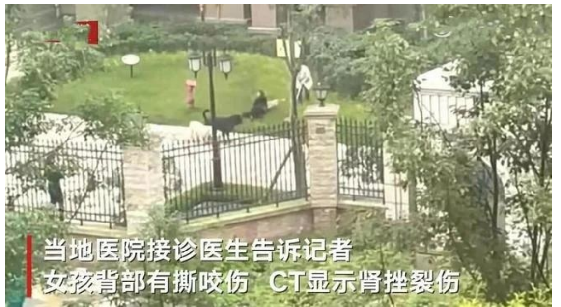
当地医院接诊医生告诉记者 女孩背部有撕咬伤 CT显示肾挫裂伤

作者钟家钰律师的热线号码 301-969-8999;微信号:AZhongLawHelp