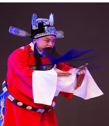
李响在《状元媒》中的吕蒙正