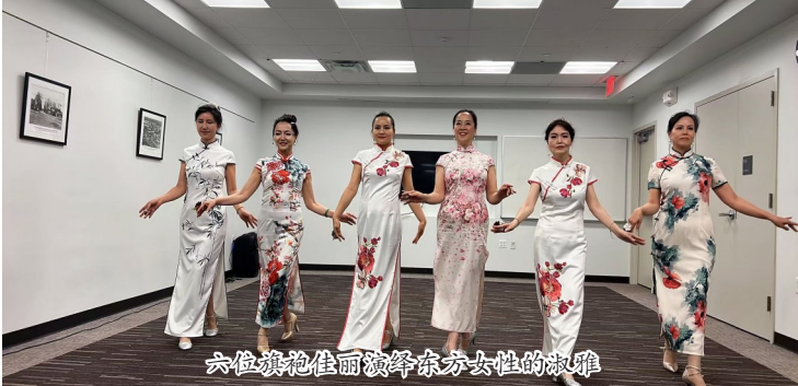
六位旗袍佳丽演绎东方女性的韵味