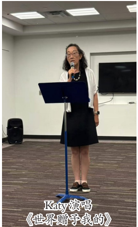
Katy演唱《世界赠与我的》