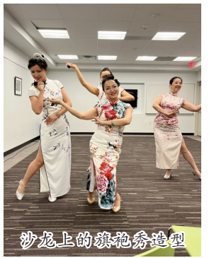
沙龙上的旗袍秀造型