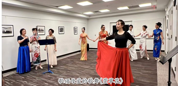
歌颂母爱的歌舞《萱草花》