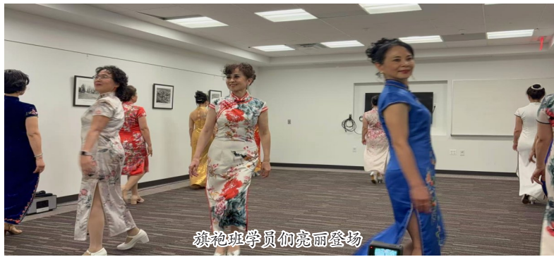
旗袍班学员们亮丽登场