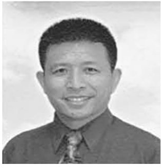
Short sale, 出租, 银行拍卖房买卖专家