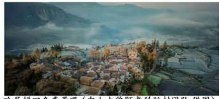
哈尼梯田冬季景观

其次，哈尼梯田的命脉在水。梯田是山地农业的常见形式，一般有旱田和水田之分。旱田主要分布于降雨量较少的半湿润半干旱地区，适合种植耐旱的农作物。例如，位于太行山区的河北省邯郸市的涉县梯田就是旱田的典型，而哈尼梯田可以作为水田的代表。这里的梯田几乎一年四季都泡在水里；夏秋时节栽满禾苗，稻浪翻滚；即使到了冬天，稻子收割后仍然放水泡田，此时梯田里水平如镜，黑色的田埂沿着地势和等高线，描绘出疏密不等的曲线，因而哈尼梯田成为让摄影家流连忘返的天堂。但是，在山坡上种植水稻却面临着很大的挑战。哈尼梯田的水从哪里来？为什么这些梯田的水沟里会有昼夜不