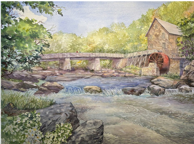
水彩画《格莱德溪磨坊》(The Glade Creek Grist Mill), 21" x 29", 2024