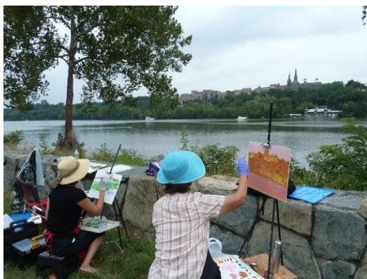
在波多马克河边写生