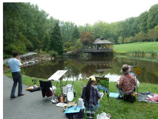
在公园一角日本亭前写生