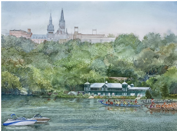
水彩画《远眺乔治城大学》(A Distant View of Georgetown University), 21" x 29", 2024