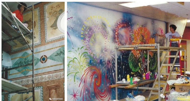
沉浸于创作中的张明明 (左为希腊雅典某豪宅之壁画创作, 右为美军某运动中心创作现代风格的壁画)