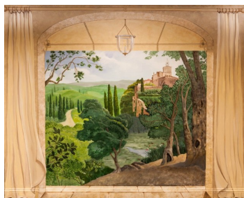
维州某办公室壁画

张明明 (Mingming Cheung), 华裔画家、作家, 亦是中美文化艺术交流、传播的摆渡人。1940年生于重庆, 是已故著名小说家、文学大师张恨水的长女。