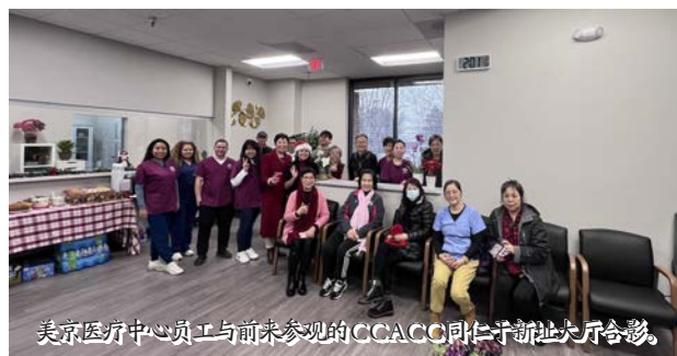
美京医疗中心员工与前来参观的CCACC同仁于新址大厅合影。