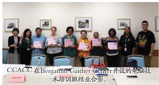
CCACC在Benjamin Gaither Center开设的电脑技术培训结业合影。