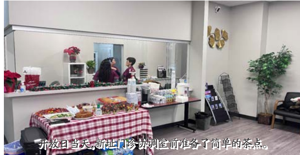
开放日当天,新址门诊协调室前准备了简单的茶点。