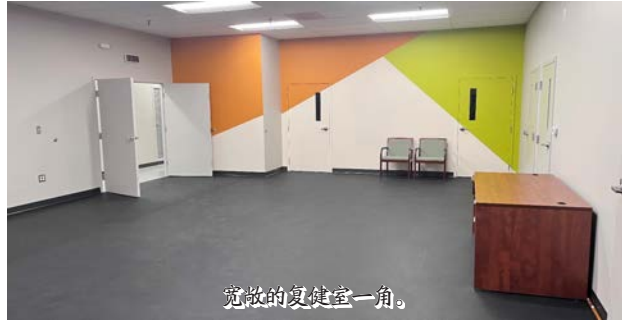
宽敞的复健室一角。