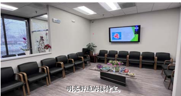
明亮舒适的接待室。