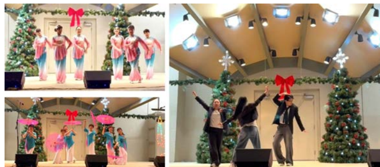
左上: 常青社“芳华舞蹈队”表演戏曲舞蹈《黄梅悠悠》;左下: 常青社“快乐舞蹈队”表演古典舞《油纸伞》;右: 由Wootton高中学生组成的“CStar”表演街舞。