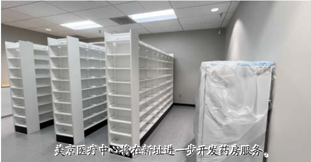
美京医疗中心将在新址进一步开发药房服务。