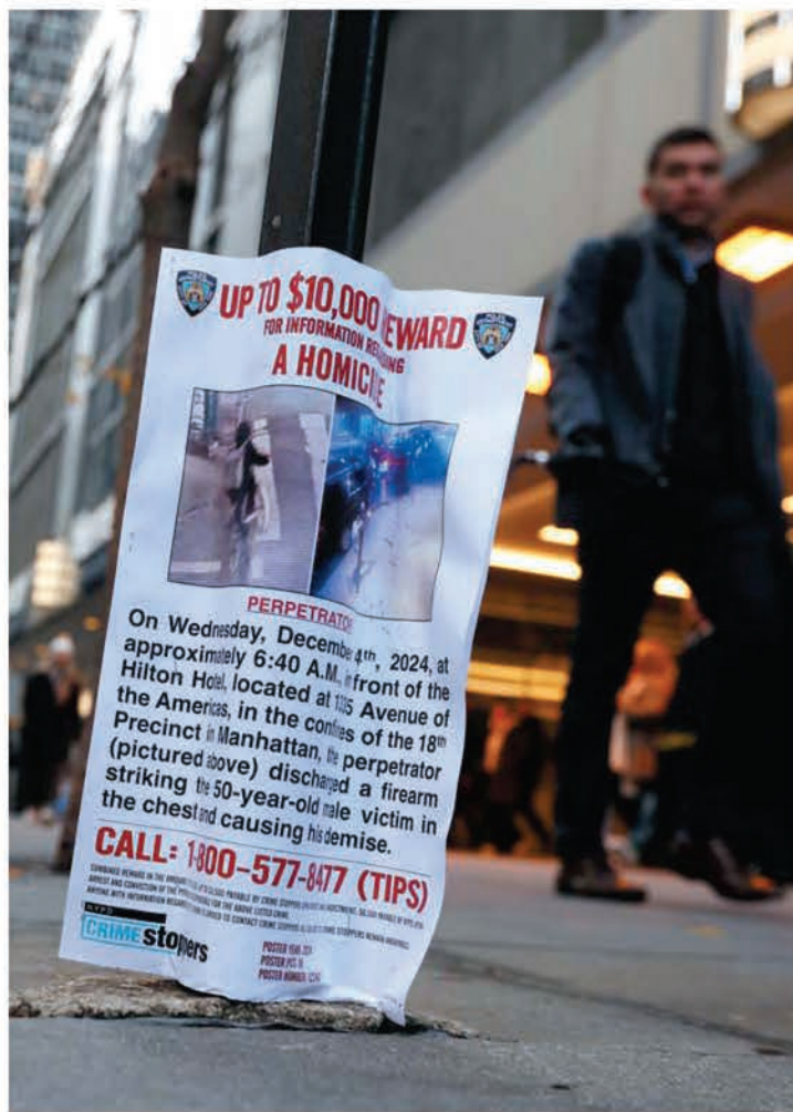
这是12月5日在纽约曼哈顿街头拍摄的悬赏征求枪手线索的海报。

这起枪击案激起美国民众对医保公司的强烈不满。英国广播公司(BBC)报道称，美国网络上的愤怒似乎都超越了政治分歧，左翼和右翼人士都对保险公司表达了敌意，凸显出美国人对保险公司和整个系统的深深失望。