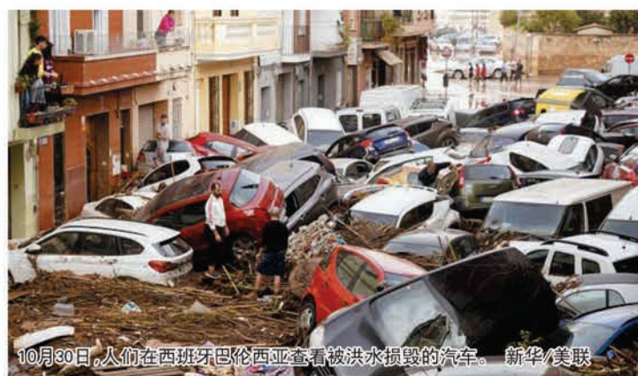
10月30日，人们在西班牙巴伦西亚查看被洪水损毁的汽车。

“如果能更好地协调管理，提前预警，孩子们就能得救，他们的父母也不会经历这样炼狱般的痛苦。”乔纳森说，官方红色警报在洪