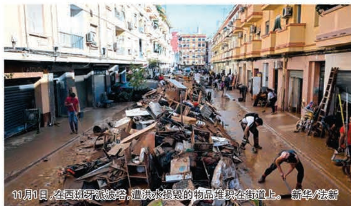
11月1日，在西班牙派波塔，遭洪水损毁的物品堆积在街道上。