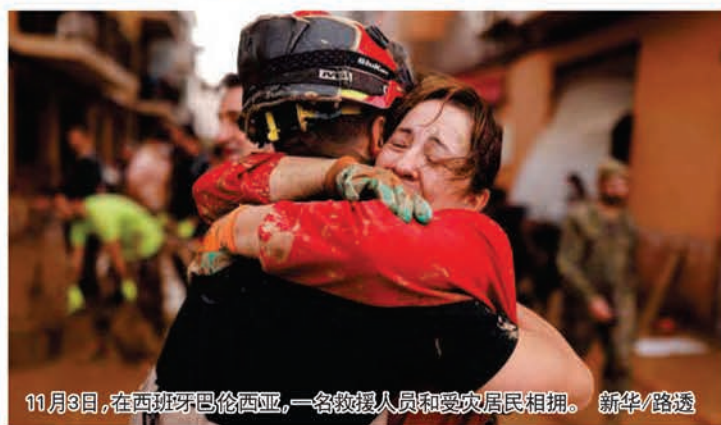
11月3日，在西班牙巴伦西亚，一名救援人员和受灾居民相拥。